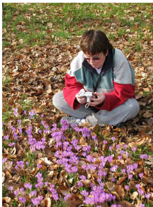
(Ingezonden door Ria Snoek)