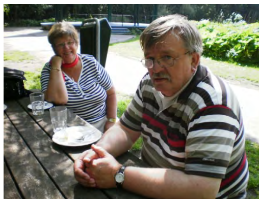
(Ingezonden door Henk Beekman)

Hieronder een selectie van de ingezonden foto's.